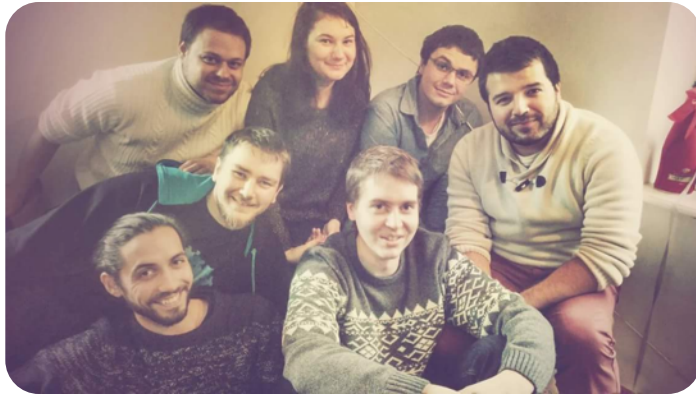
LE BUREAU NATIONAL