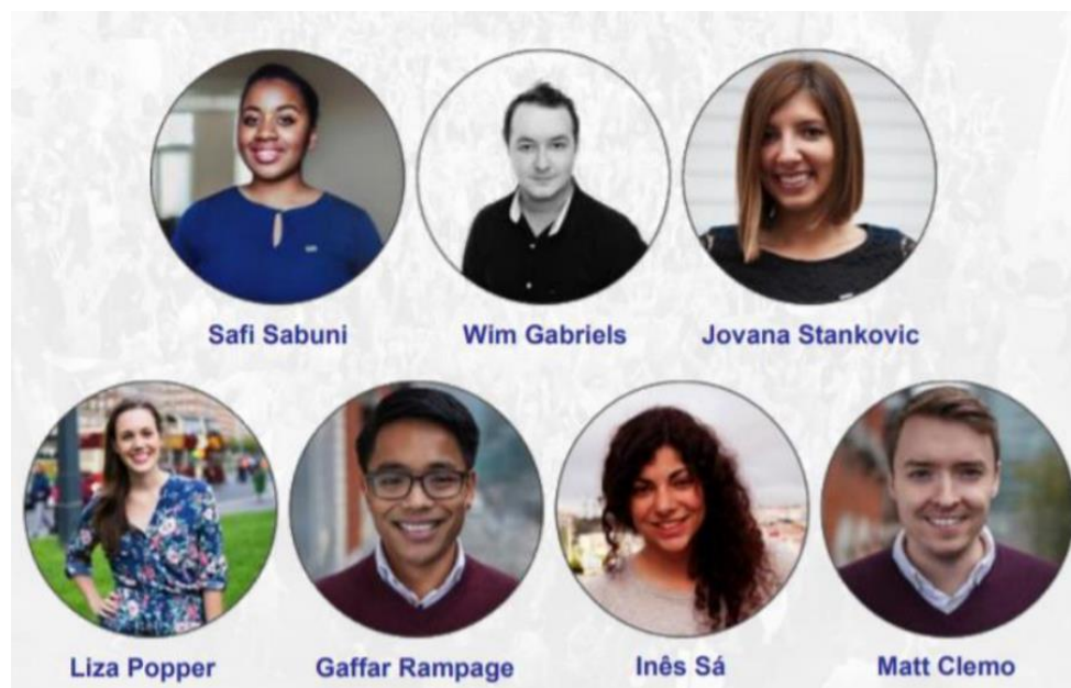
Membres de la Structural Taskforce

L'IB a créé une « Structural Taskforce » (STF), laquelle a été missionnée pour l'implémentation des suggestions détaillées dans l'ESNreview. La STF a travaillé en étroite coopération avec le bureau international pour la mise en place des idées contenues dans le rapport et pour l'adaptation des documents officiels du réseau.